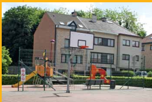
't Hof te Overbeke (August Deniestraat)