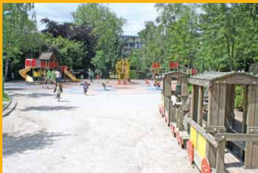
Pirsoulpark (Koning Albertlaan /Bloemkwekersstraat)