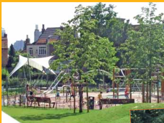
De Mulderpark (Josse Goffinlaan)