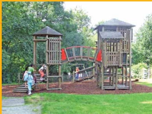
Wilderbos (intrede Groendreefstraat)