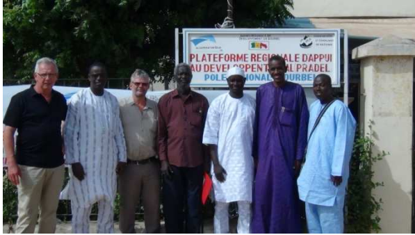
Diourbel / Gesves