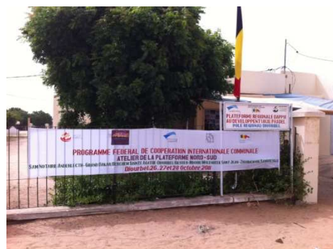
Spandoek van het platform