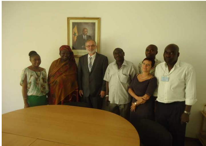
Meeting met de directrice van DRS/SFD (Direction de la Réglementation et de la Supervision des Systèmes Financiers Décentralisés – Directoraat voor de reglementering en het toezicht op gedecentraliseerde financiële systemen )