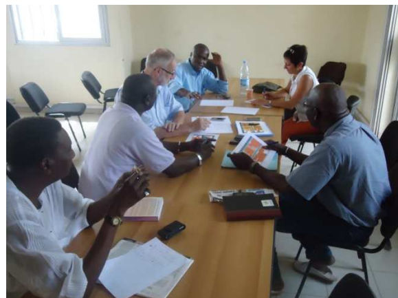
Werkvergaderingen van de twee stuurcomités (Grand-Dakar en Berchem)