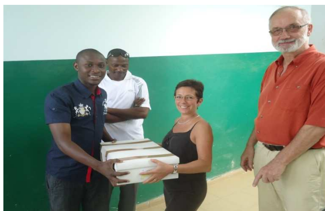
Overhandiging van de geneesmiddelen aan de hoofdgeneesheer van het gezondheidscentrum van Grand-Dakar