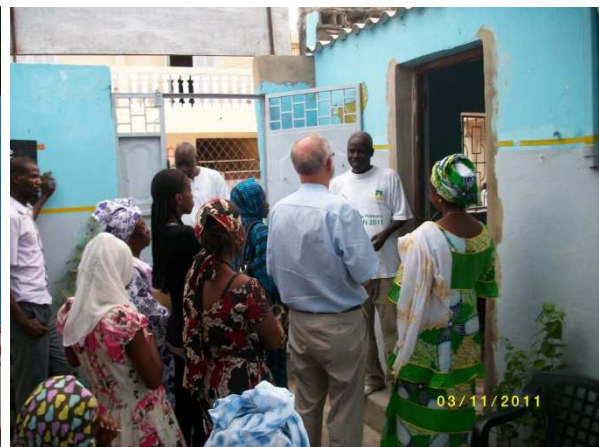
Bezoek aan de eenheid Snit & Naad