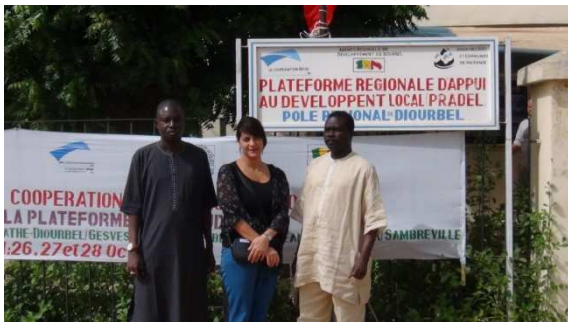
Mbour / Sint-Jans-Molenbeek