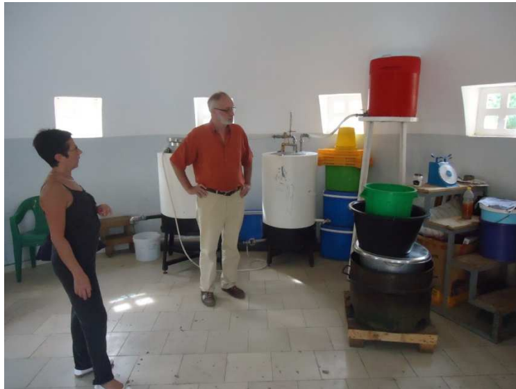
Bezoek aan de eenheid Verwerking van lokale producten