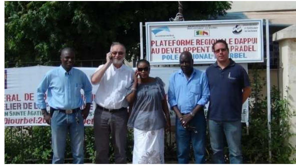
Grand-Dakar / Sint-Agatha-Berchem