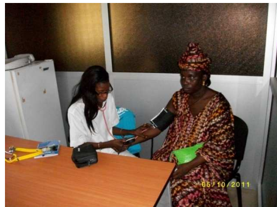
Opsporen van borstkanker