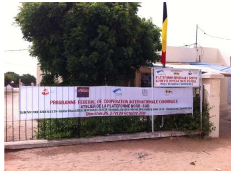
Banderole de la plateforme