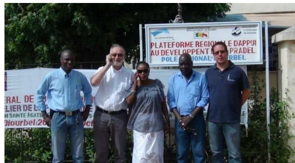
Grand-Dakar / Berchem-Sainte-Agathe