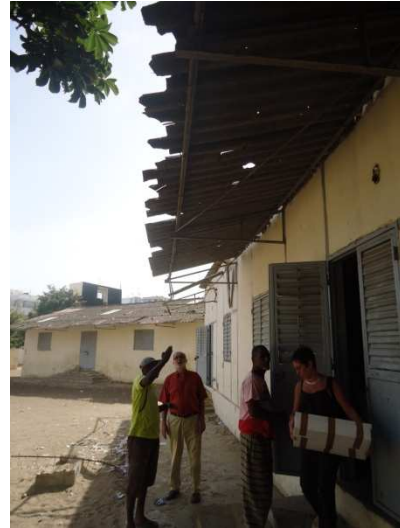
Visite de l'école Route des Puits