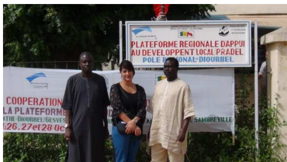
Mbour / Molenbeek Saint-Jean