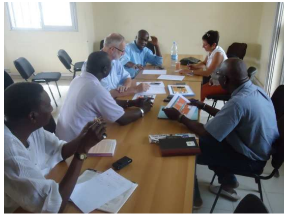
Séances de travail des deux Comités de Pilotage (Grand-Dakar et Berchem)