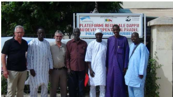
Diourbel / Gesves