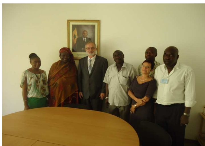
Rencontre avec la Directrice de la DRS/SFD